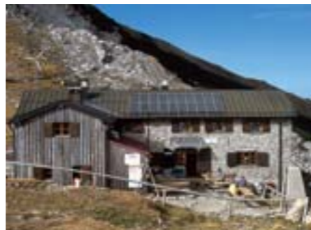
Die Weilheimer Hütte im Estergebirge

Von Oberau aus ist die Wanderung zur Weilheimer Hütte (1955 m) im Estergebirge, die auch Übernachtungsmöglichkeit bietet, eine wunderschöne Bergtour.