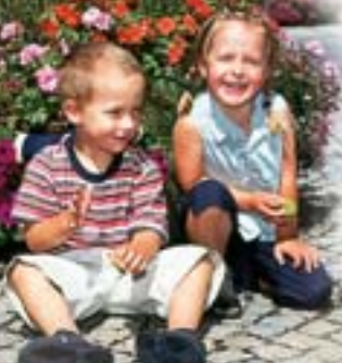
Prächtig, der Blumenschmuck in Oberau

Zu fröhlichen Waldfesten mit echt bayerischer Musik und Tanz trifft man sich im Vereinsheim des Trachtenvereins. Auch das Bauerntheater sorgt hier für vergnügliche Unterhaltung.