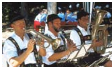
Unterhaltung und Unterma- lung bei Veran- staltungen durch die Oberauer Blasmusik

Schwimmbad, 4 Tennisplätze, 6 Asphaltbahnen am Sportplatz, Golfplatz (18 holes), Kegelbahnen; einen Skilift, eine Rodelbahn, Eislaufplatz, Eistockbahnen und das weit ausgedehnte Loipennetz.