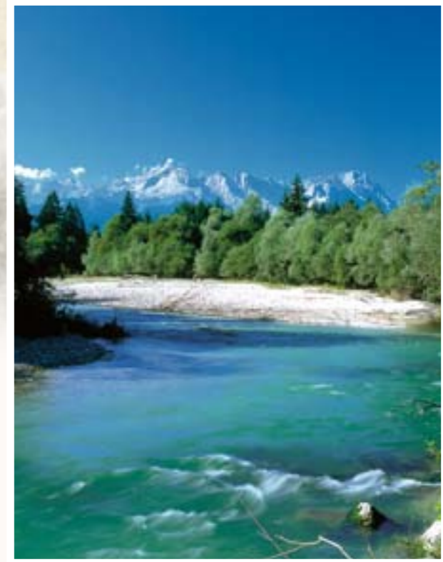
In den Loisachauen bei Oberau