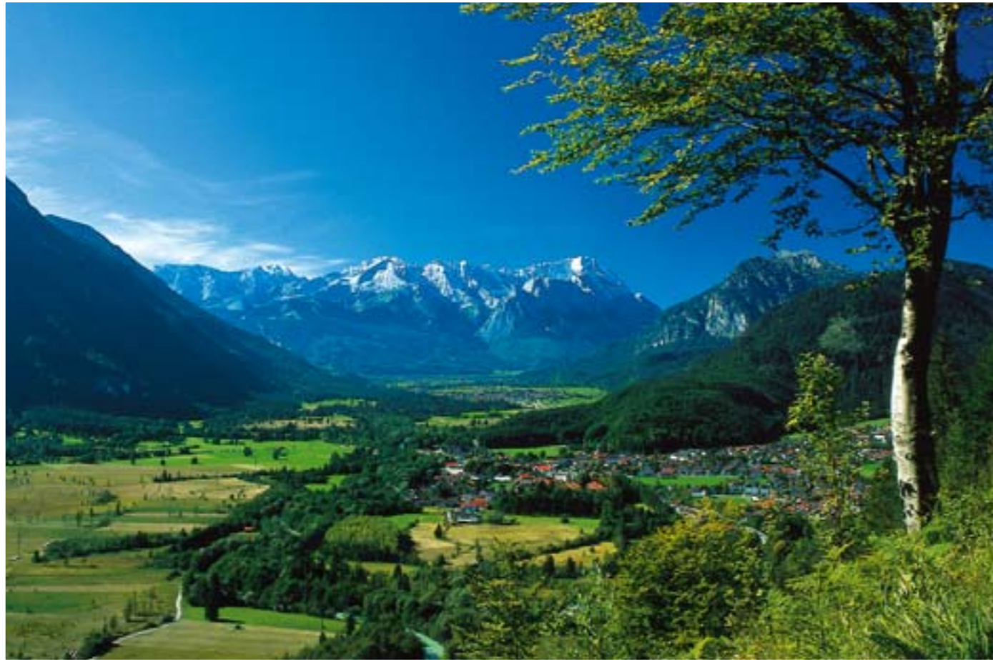
Aussicht vom „Loisachblick“ auf Oberau und das Wettersteinmassiv mit der Zugspitze (2963 m)