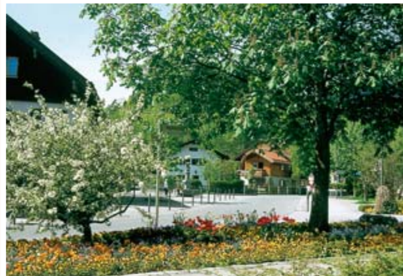
Frühlingsblüte in Oberau

Umgeben vom Ester- und Ammergebirge mit Blick auf die Alp- und Zugspitze im Wettersteinmassiv begrüßt Sie der staatlich anerkannte Erholungsort Oberau im Zugspitzland und wünscht Ihnen einen schönen Urlaub, an den Sie stets gerne zurückdenken werden.