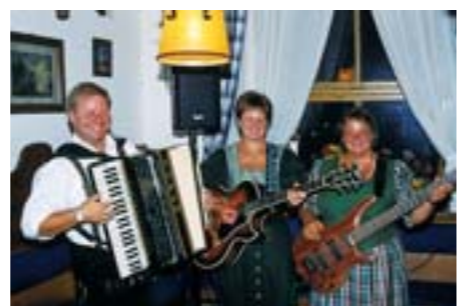
Wir freuen uns auf Ihr Kommen!

Herzlich willkommen beim Gästebegrüßungsabend Gästebegrüßungsabende, die aktuelle und interessante Urlaubsinformationen vermitteln, finden von Mai bis September statt. Umrahmt wird der Abend von echter bayerischer „Stubnmußi“ und Schuhplattlern. Ein wunderschönes, gelungenes, informatives und unterhaltsames Programm führt Sie durch den Abend. Selbstverständlich ist der Eintritt mit der Gästekarte frei.