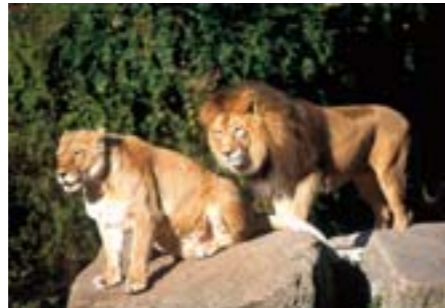
Im Augsburger Zoo

Beschaulich und bezaubernd schön ist das für alle Altersstufen geeignete, weit ausgedehnte Loipengebiet im Loisachtal. Und wer gerne einmal höher hinauf will, die Pisten in Garmisch-Partenkirchen sind nur einen Katzensprung von Oberau entfernt und werden allen Ansprüchen gerecht.