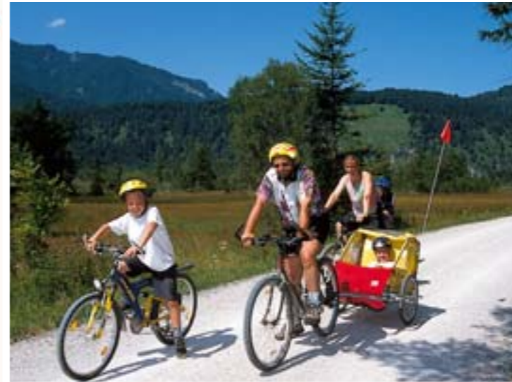
Radeln und Wandern im Loisachtal, für alle Altersstufen eine Freude